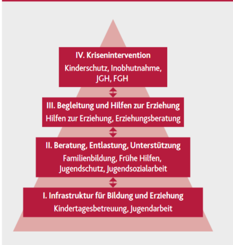
Abb. 48: Jugendhilfe wirkt nur als Ganzes gut